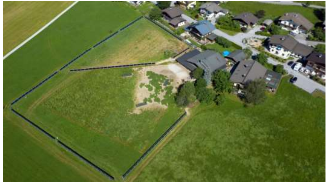
1 ha für 1000 Bio Legehennen