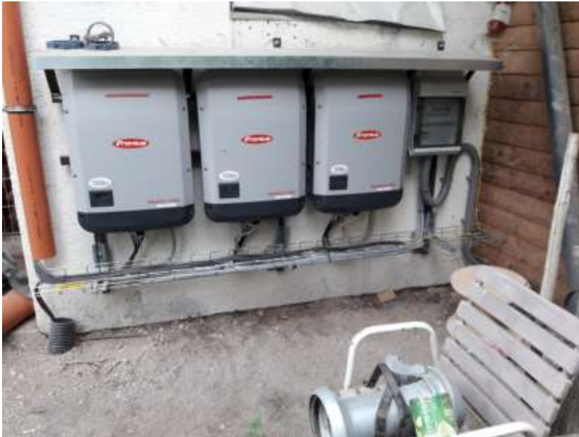
Anschluss der drei Wechselrichter