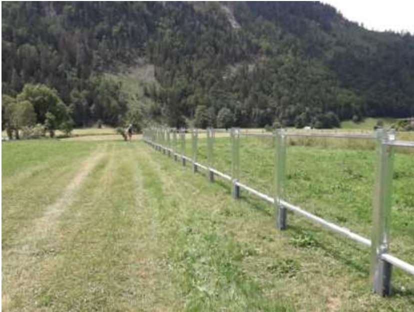
Montage der verzinkten Stahlprofile