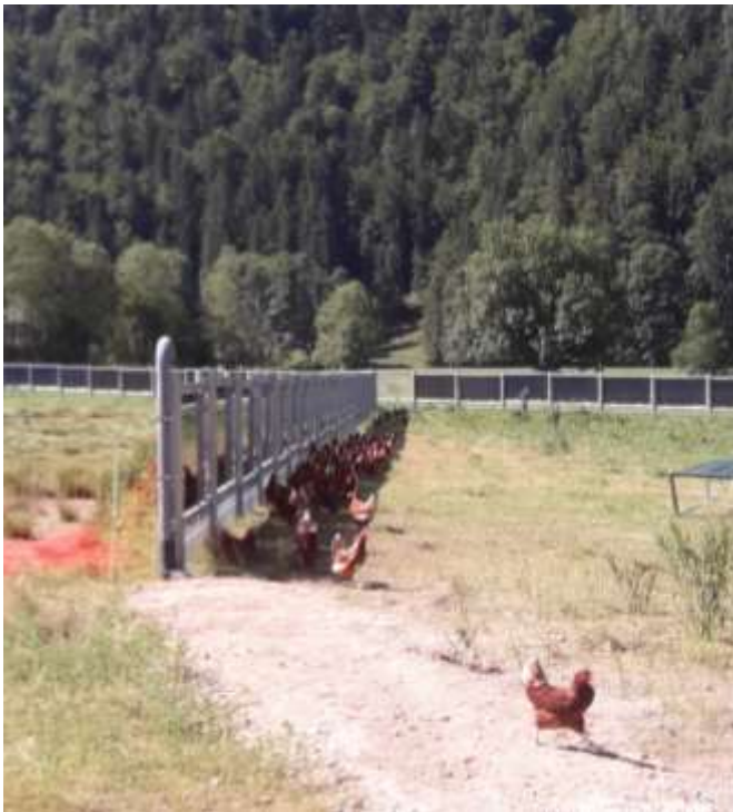
Glückliche Hühner im Schatten