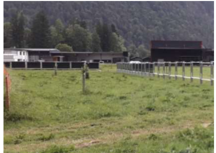
Einhängen der bifacialen PV Module