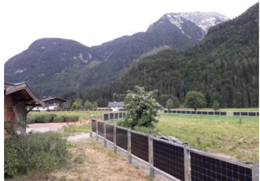
Jahresertrag ca. 53.000 kWh