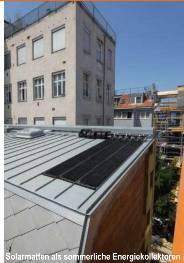
Solarmatten als sommerliche Energiekollektoren