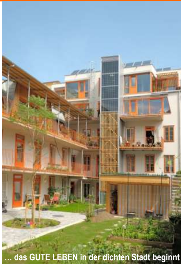
... das GUTE LEBEN in der dichten Stadt beginnt