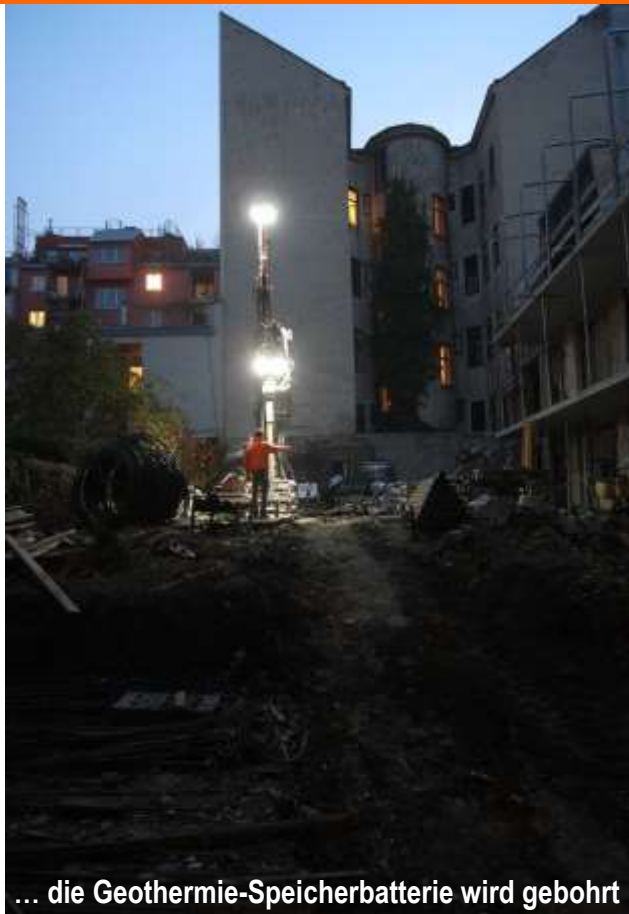
... die Geothermie-Speicherbatterie wird gebohrt