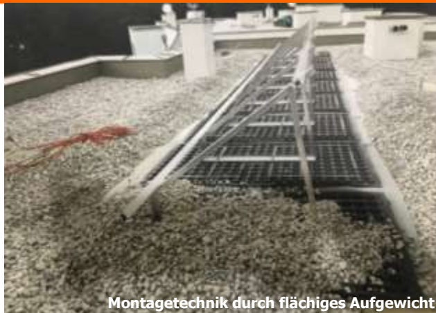
Montagetechnik durch flächiges Aufgewicht