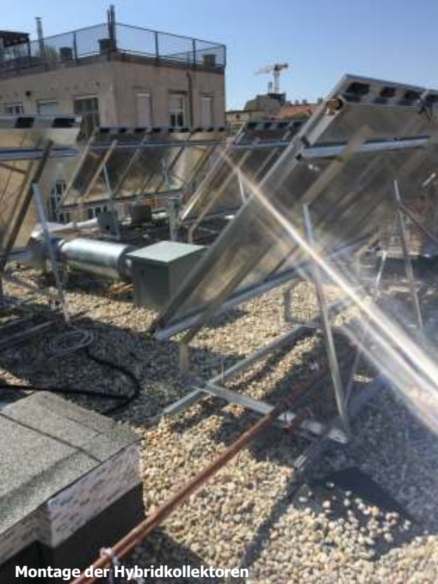
Montage der Hybridkollektoren

... Hybridkollektoren + transparente PV-Paneele