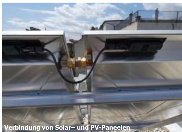
Verbindung von Solar- und PV-Paneele